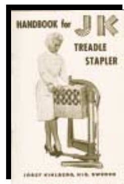
Framsidan av "Handbok för Bottenhäftare"