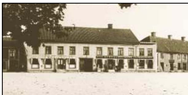
1907 ändrades namnet till Kihlberg & Källmark Järnhandel.

Lämpliga verkstäder och kunniga arbetare fanns ju redan."