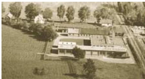
1957 Verkstadsbyggnad nummer två uppfördes på nuvarande område.