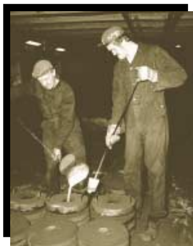
1942 Inköptes gjuteriet som låg på nuvarande fabriksområde.

1943 Världskriget förorsakade allvarliga svårigheter att importera. Josef Kihlberg AB började då med en egen tillverkning av häftklammer och häftapparater. Snart täckte häftklammerproduktionen hela det svenska behovet och man började också exportera.