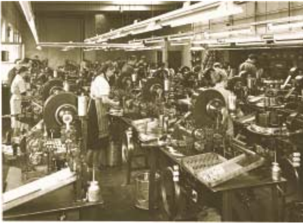
Klammertillverkning i fabriken vid Lützowstrasse.