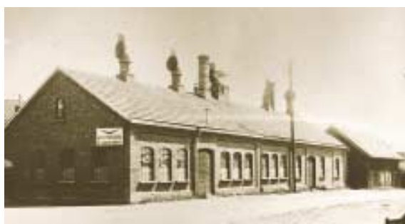
1982 Fjäderfabriken lades ner. Här hade tillverkningen pågått oavbrutet sedan 1909.

1965 Produktionen av klammer och verktyg utgjorde nu 90 procent av den totala försäljningen.