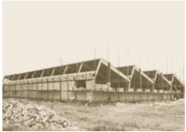
Byggnation av den nya fabriken i Hemmingen.